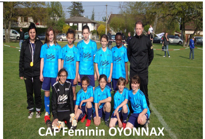
CAF Féminin OYONNAX

après-midi et se sont qualifiées pour la finale régionale qui aura lieu à St Genis Laval le mardi 8 Mai prochain. Bonne chance à nos représentants et merci au FCBP pour la parfaite organisation et la qualité de l'accueil lors de ces finales.