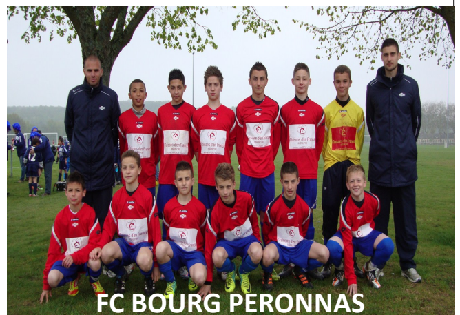
FC BOURG PERONNAS