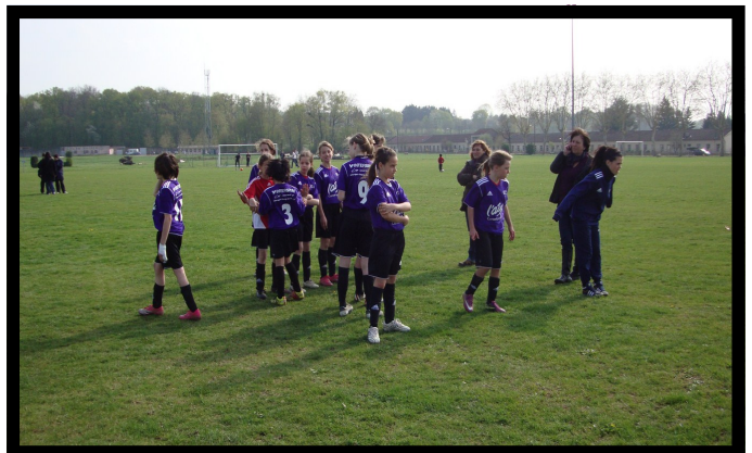
Finale Départementale U13 Féminine