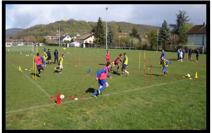
Module U11—St Denis en Bugey