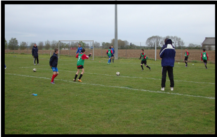
PES 99—St Martin du Mont