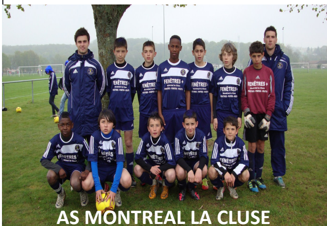
AS MONTREAL LA CLUSE