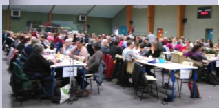
Loto de l'Avenir en octobre