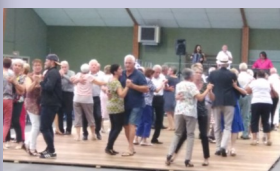
Thé dansant de septembre