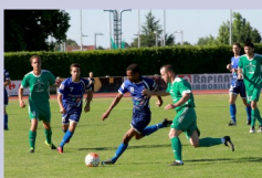
10.06.2017—Coupe de la Creuse à Guéret contre Aubusson