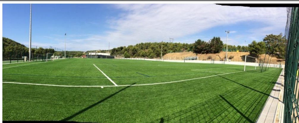
Stade municipal d' Ensues la redonne