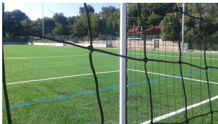
Stade municipal de La Couronne à Martigues sud