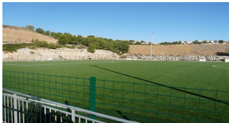
Stade municipal de Sausset les Pins