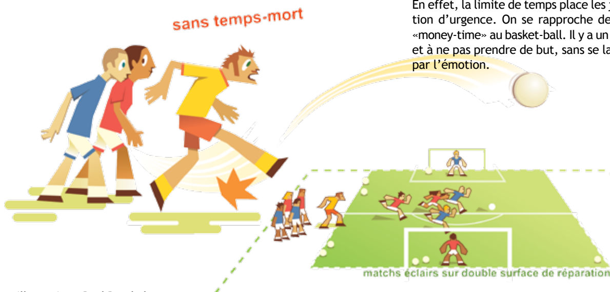
illustration : Paul Burckel

Les joueurs vont non seulement améliorer leur vivacité et leurs capacités aérobies (par l'intermittence des temps d'efforts/temps de récupération), mais aussi leur efficacité devant le but. En effet, la limite de temps place les joueurs en situation d'urgence. On se rapproche de la situation du «money-time» au basket-ball. Il y a un enjeu à marquer et à ne pas prendre de but, sans se laisser submerger par l'émotion.