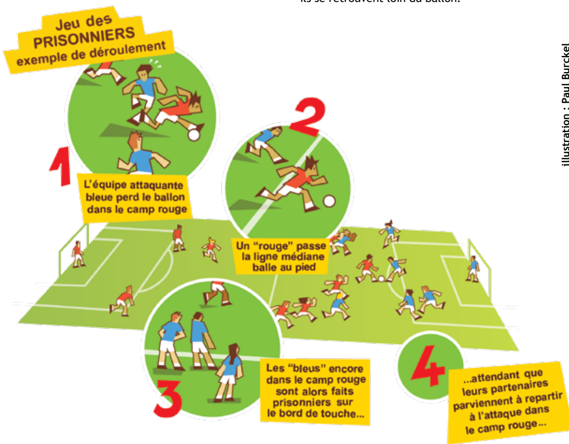
illustration : Paul Burckel

Les joueurs s'entraînent ici à anticiper le moment où leur équipe gagne la balle et le moment où elle risque de la perdre. Par exemple, des joueurs ne participent aux efforts défensifs qu'après la perte de balle, d'autres seulement lorsqu'ils sont à proximité de la balle. Ces 2 jeux vont les entraîner à anticiper la perte du ballon pour se replacer immédiatement en défense et prévenir la contre-attaque adverse, y compris quand ils se retrouvent loin du ballon.