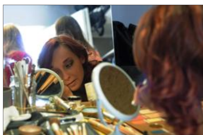
Pour le maquillage, une professionnelle était à l'oeuvre mais chaque candidate avait la possibilité d'apporter sa touche.