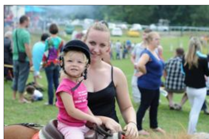
Les balades à dos de poney ont beaucoup plu aux tout-petits. Les animations s'adressaient à tous les publics sur le site du stade.