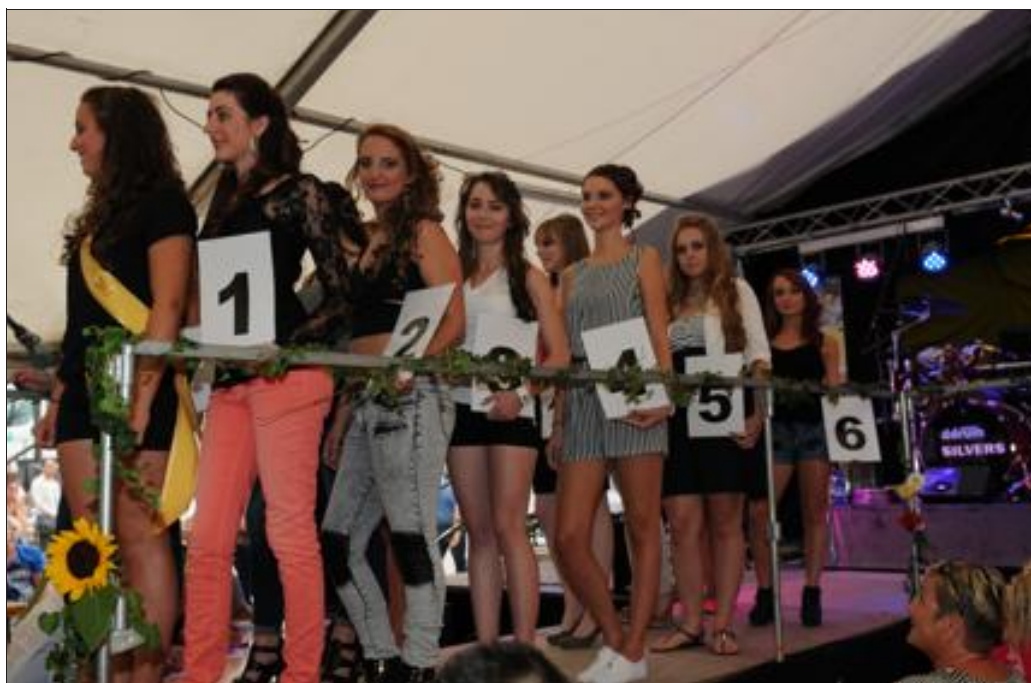
Défilé en tenue décontractée, en tenue de soirée et en maillot de bain : les candidates à l'élection de Miss mirabelle ont chacune rémordu à quelques questions sur scène.