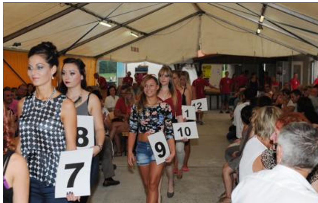
Le premier prix du concours de Miss mirabelle est un chèque de 250 €, un bouquet de fleurs et une séance de photos dans un studio professionnel. La gagnante aura pour seule mission de coacher les candidates lors de l'élection en