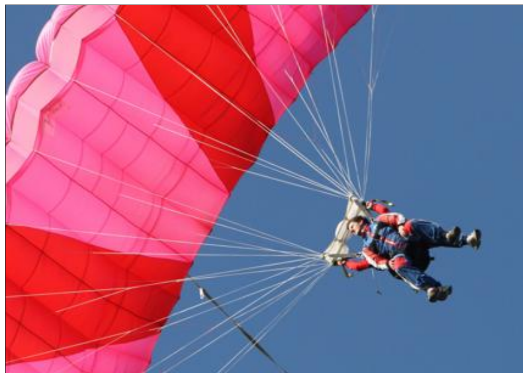
Le club de parachutisme de Sarrebourg recrute. Il tiendra un stand à la fête du sport, le 7 septembre au Cosoc.

Renseignements au tél. 06 07 09 22 72 ou par mail : gerard.baumgarten123@orange.fr.