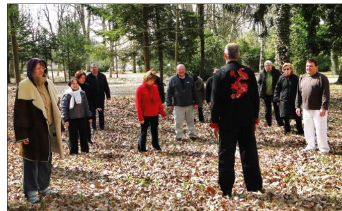
L'arboretum du couvent est un lieu idéal pour la pratique des exercices millénaires venus d'extrême orient.

Contacts : www.lescinquelements57.com. Téléphone 03 87 07 82 66.