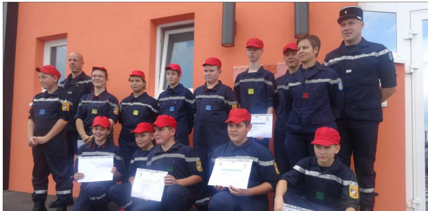
Les jeunes soldats du feu se sont vus remettre leur galon de couleur.

Une fois la salle de formation franchie, tous ont obéi, un peu hésitants, à leurs premières instructions. « Le parcours nécessite assiduité dans la présence, sérieux dans l'apprentissage, rigueur dans l'exécution. Ils découvriront le travail en équipe, le respect du drapeau, de l'hymne national. Cela peut paraître à certains un peu vieillot, mais pour nous, c'est essentiel », résume le lieute-