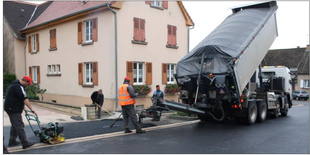
L'entrée nord du village offre un nouveau visage après les travaux d'aménagement.

Ces travaux de voirie complètent ainsi le projet d'aménagement dessiné et dirigé par le bureau d'études C.V. Ingénierie de Danne-et-Quatre-Vents pour cette année.