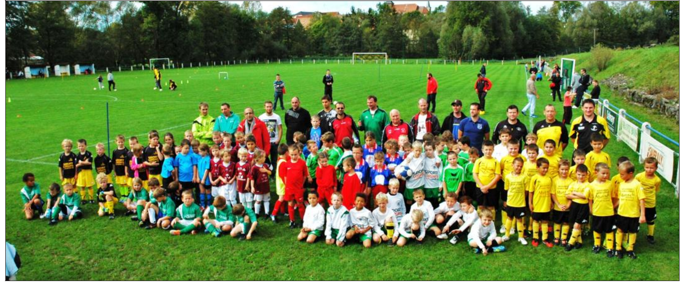
Ambiance sur le stade magnifiquement aménagé, avec le soleil en prime : 14 équipes de U6 à U9 étaient présentes !

été très satisfaits du déroulement du plateau qui a été suivi par de très nombreux parents et surtout quelques grands-pères. L'un d'eux se plaignait néanmoins, mais avec un certain