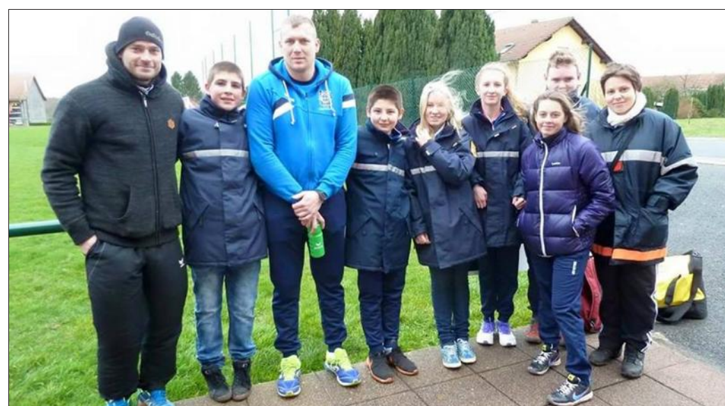
Au terme des différentes courses àprement disputées, le centre local a enregistré de belles performances.

se positionnant honorablement à la 5e place. Ce classement lui