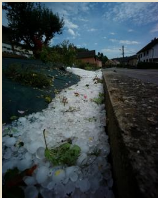
En plein mois d'août, les rues de Walscheid recouvertes par une insolite couche de grêlons.

Il semblerait que seul Walscheid et Harreberg aient véritablement fait les frais de l'orage qui s'est abattu hier en milieu de journée sur le pays de Sarrebourg. Uniquement des dégâts matériels sont à déplorer dans les jardins, sur les toits, et parfois les carrosseries.