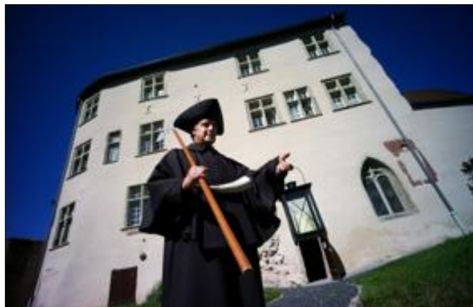
Le veilleur de nuit conduit la balade à la lueur de sa lanterne.

À 22 h, le week-end, un bien étrange spectacle se déroule dans la cité médiévale. Le veilleur de nuit, garant de la sécurité nocturne des habitants au Moyen Âge, a investi le rôle de guide touristique. Il emmène les visiteurs à la rencontre du fabuleux patrimoine de Fénétrange. Porte de France, Porte du Château, Maison des Fers, hospice, ancienne synagogue et autres vestiges du passé ponctuent la balade à la lueur de sa lanterne et sous la protection de sa halberd.