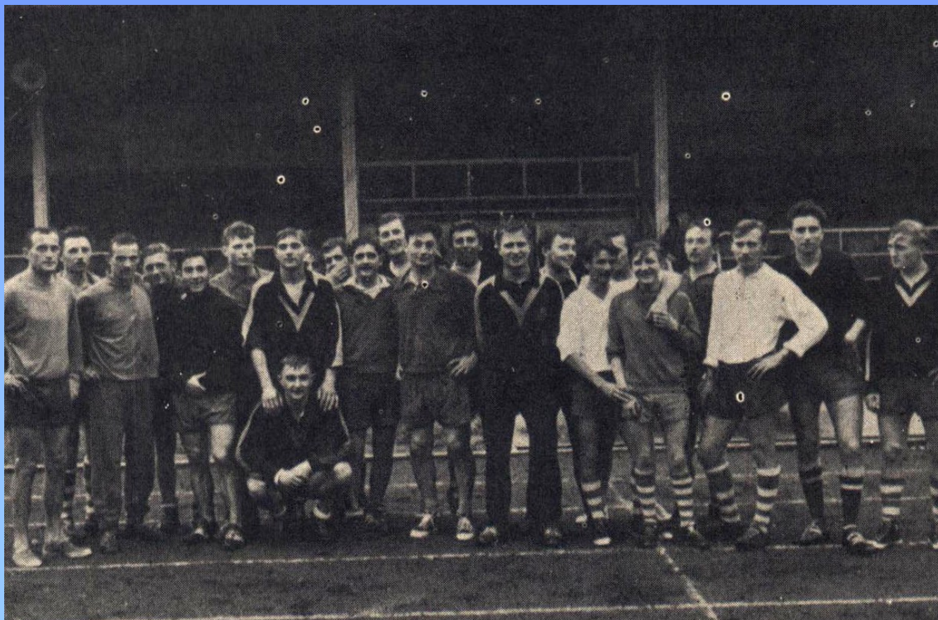
A l'entraînement, les équipes première et juniors