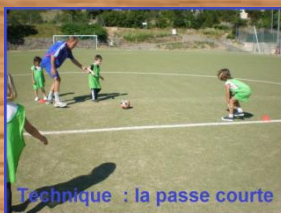
Technique : la passe courte