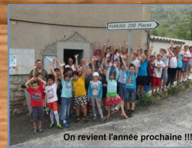
On revient l'année prochaine !!!