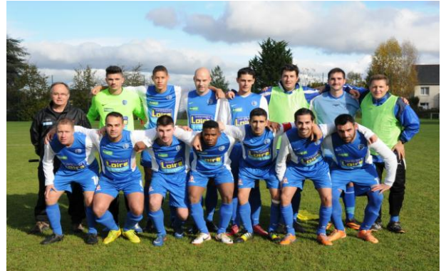
Equipe Sénior 2