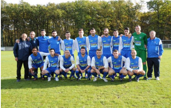
Equipe Sénior 1