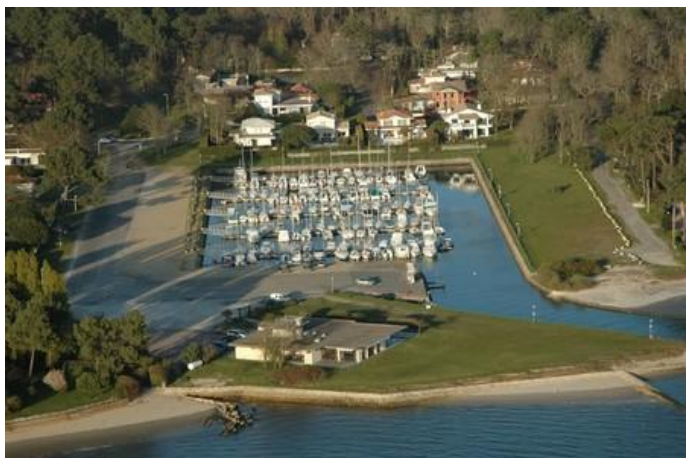
Un des trois ports de la commune de LANTON

http://www.littoral33.com/Lanton_Tourisme.htm