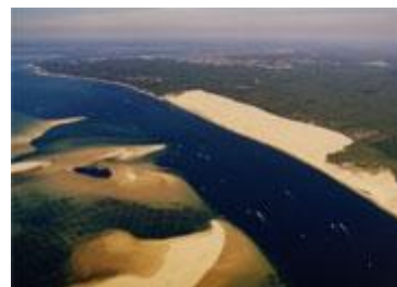
Les plages océanes