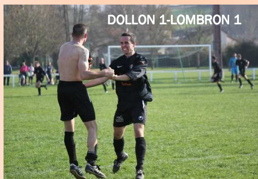
DOLLON 1-LOMBRON 1

La joie dollonnaise après leur 2ème but en fin de match contre LOMBRON