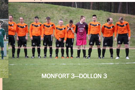
MONFORT 3-DOLLON 3