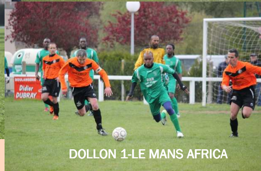
DOLLON 1-LE MANS AFRICA

La joie dollonnaise après leur 2ème but en fin de match contre LOMBRON