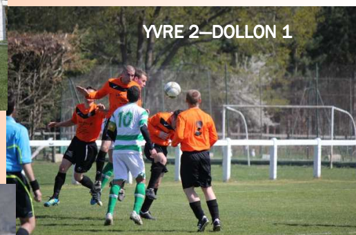
YVRE 2-DOLLON 1

Premier nul de la saison à YVRE , match très disputé face à une belle équipe