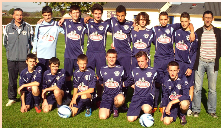
L'équipe U17 ENT.VIBRAYE/DOLLON/MONTMIRAIL/CORMES