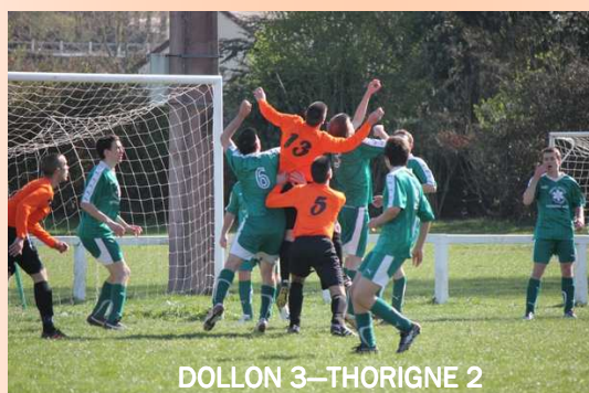
DOLLON 3-THORIGNE 2

Match nul comme l'équipe 2 le même jour, 1-1