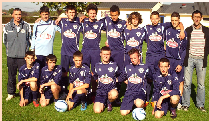
L'équipe U17 ENT.VIBRAYE/DOLLON/MONTMIRAIL/CORMES

« Le niveau a considérablement augmenté. Cette année le mental de l'équipe A est totalement différent. Il est plus costaud exemple contre Lombron après avoir raté un pénalty ils ont réussi à se mobiliser pour gagner. L'an dernier encore ce match là il l'aurait perdu. »