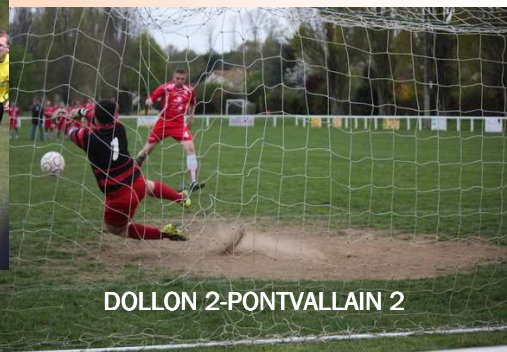
DOLLON 2-PONTVALLAIN 2

Malgré cet arrête les dollonnais seront battu aux tirs aux buts après un score de 1-1 en challenge