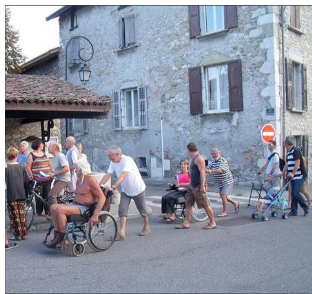
Le parcours proposé mercredi allait du carrefour de la Maison-Saint-Jean à celui du château.

Plus de trente personnes, à pied, à vélo, en fauteuil et avec des poussettes, ont participé à la première consultation participative in situ "Diagnostic en marchant" mercredi en fin d'après-midi.