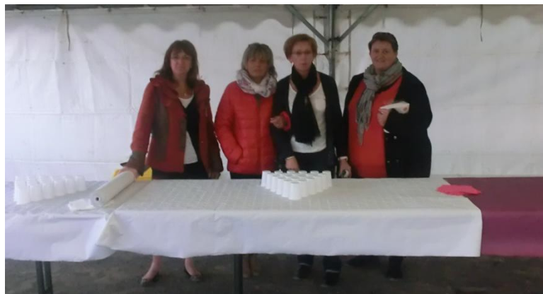
Merci à l'équipe municipale pour les préparatifs du vin d'honneur