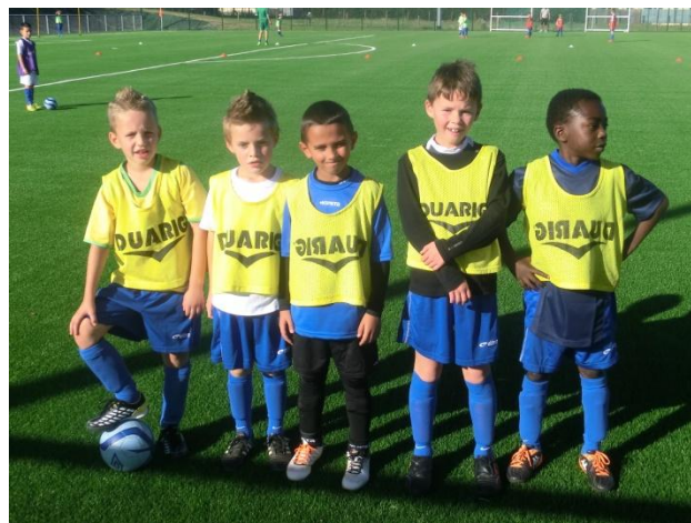
La pause !!!!