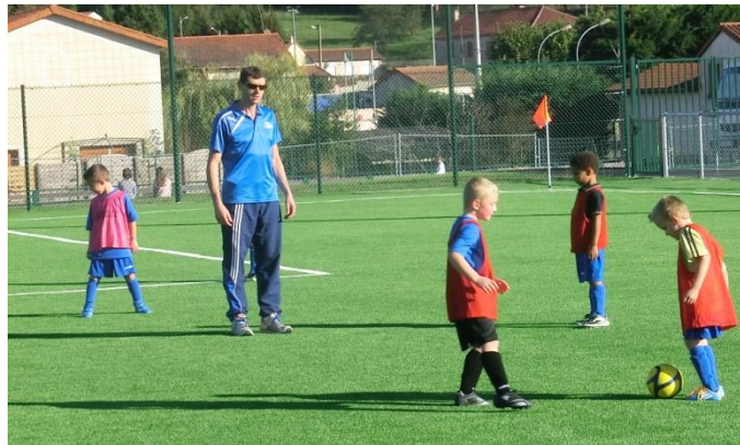
Gulliver et les lilliputiens !!!