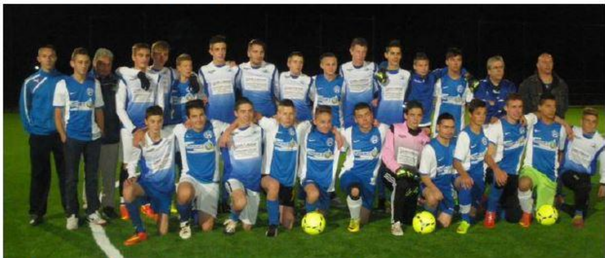
■ Les deux équipes U17 ont foulé la pelouse en synthétique.