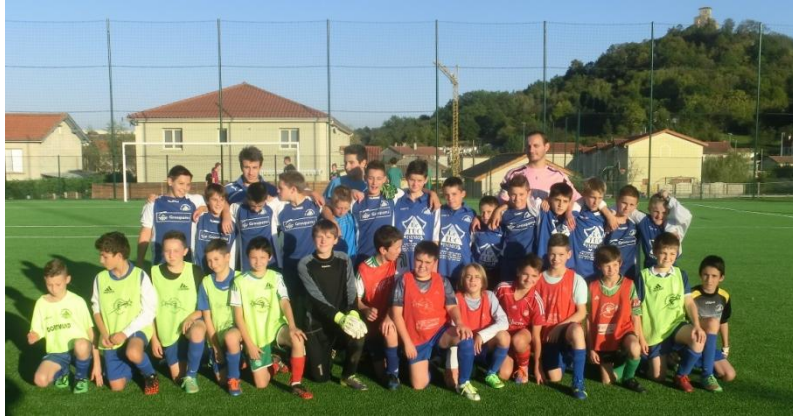
U13 avant de jouer