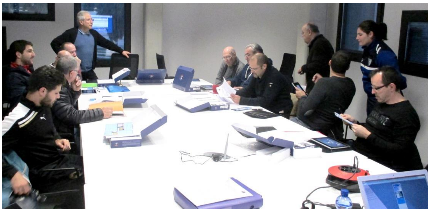
Avec les dirigeants PHB, le temps des vérifications des identifiants pour sa propre feuille de match (29 janvier 2016)

Juste à temps pour cette utilisation de la tablette chez les PHB avec la formation dispensée ce samedi 30 janvier 2016 avant les rencontres du 1 er match retour le lendemain. Quatorze présents pour la manipulation à partir de la FMI-DEMO. Cette séance conclut la mise en place de la feuille de match nouvelle forme pour les catégories U17 et PHB, dernières inscrites dans cette évolution.