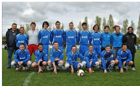
Saison 2011-2012 avec Vouillé