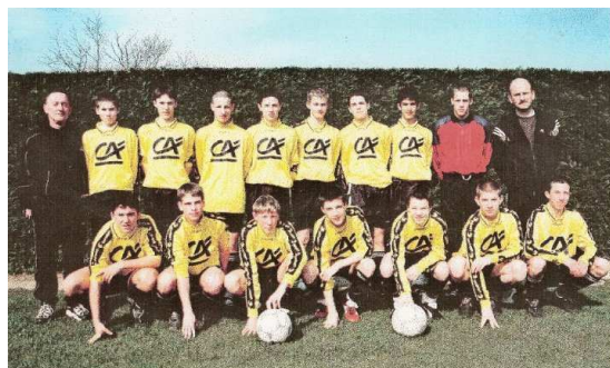
Sous les couleurs du FC Bressuire en -15 ans

Je suis arrivé au SAM en 2013 en connaissant peu de joueurs. Mais j'ai été très bien accueilli, dans ce club convivial. A notre niveau, on prend une licence pour le plaisir de jouer, mais également pour passer de bons moments après les matchs.