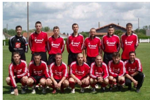
2006 : montée en D2 avec le CLNCB

A fin mars, on occupe la 4 ème place du classement de PL. Il reste encore 6 journées de championnat, et plusieurs confrontations directes entre les équipes pouvant encore prétendre à terminer en tête. Malgré deux défaites lors de nos deux derniers matchs, on conserve un moral au beau fixe grâce à notre parcours en coupe du Centre-Ouest. Notre belle victoire contre Parthenay (DHR) nous permet d'atteindre les quarts de finale, ce qui n'avait jamais été fait au club ! Le fait de réaliser des exploits successifs dans cette compétition crée une dynamique pouvant nous permettre d'atteindre nos objectifs en championnat.