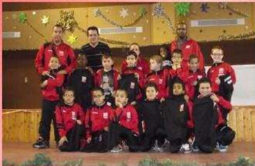
L'arbre de Noël

Les matchs de toutes nos équipes (plus de 200 matchs sur la saison, coupes et championnats confondus)