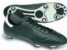
Crampons « vissés » Terrain gras ou humide