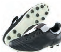
Crampons « moulés » Terrain sec ou dur

Pour entretenir ses chaussures de foot et les faire durer plus longtemps :