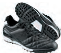
Crampons « stabilisés » Terrain synthétique