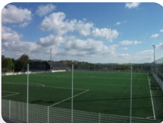
Le terrain synthétique