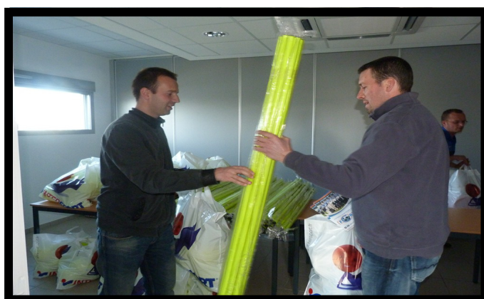
Remise des kits d'entraînements