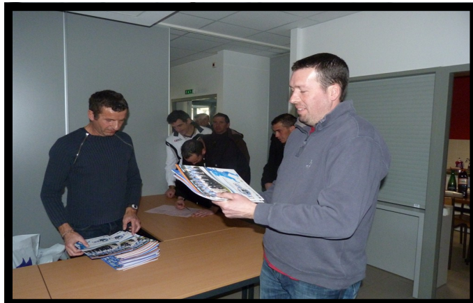
Remise des kits d'entraînements