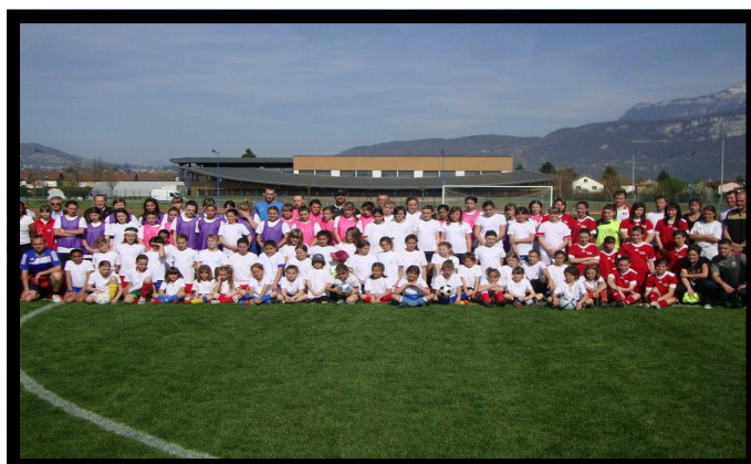
Rassemblement Féminin Moirans