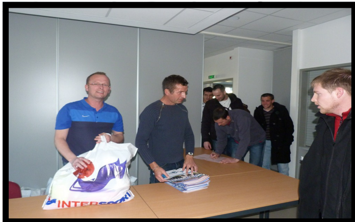
Remise des kits d'entraînements