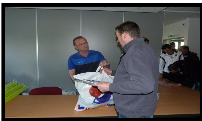
Remise des kits d'entraînements