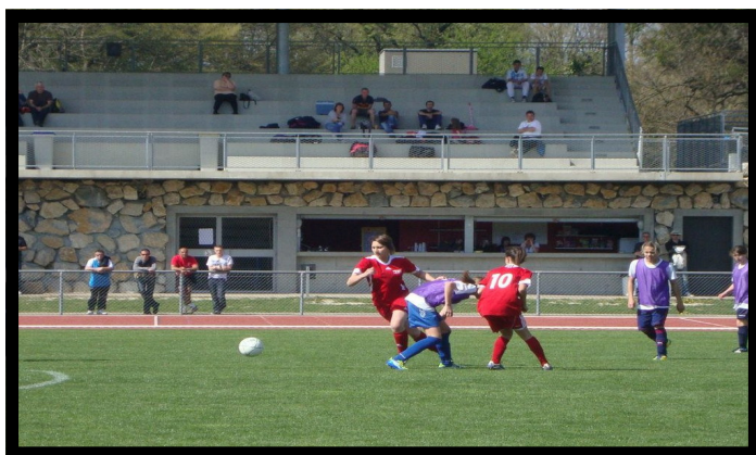
Rassemblement Féminin Moirans