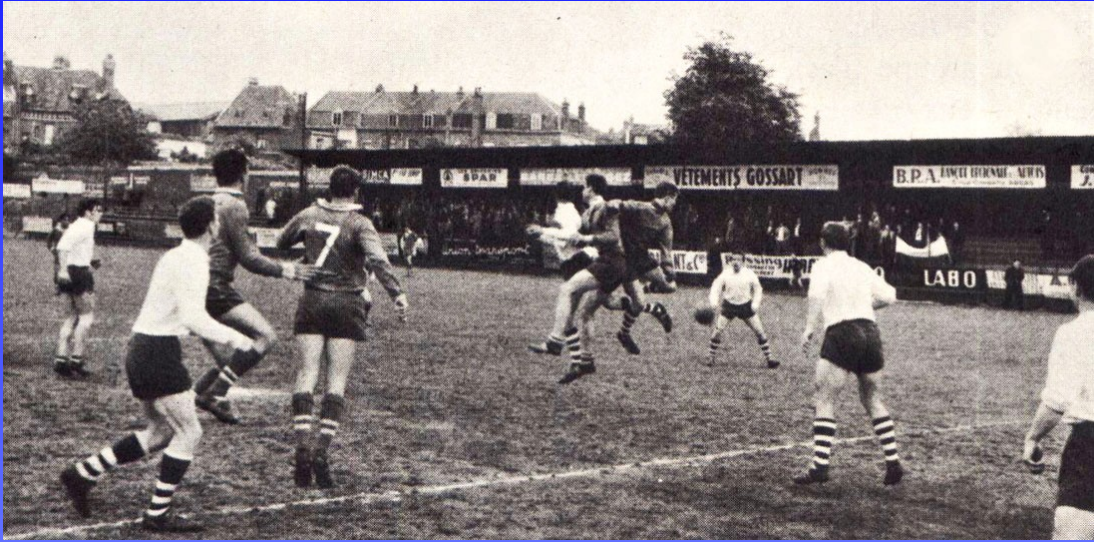
2. LA DEFENSE BARBISTE FAIT BONNE GARDE DEVANT LES ATTAQUANTS D'ARRAS.