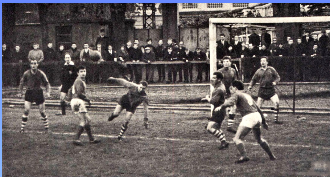
1. LA DEFENSE DES BARBISTES EST SERIEUSEMENT A L'OUVRAGE SUR UNE ATTAQUE D'ABBEVILLE.

● Parmi les autres résultats, nous relevons la défaite des Cadets de l'A.S.S.B. devant Lambersart par 5-0 et leurs victoires au tournoi d'Ostricourt devant Thumeries par 3-0 et devant Carvin par 2 à 1. Les protégés d'Harriot enlèvent ainsi le challenge du Rapid. Les Cadets B ont été battus par Lesquin : 3-2, Houplin : 7-3 et Ascq : 5-1. Ils ont gagné face à Annœullin par 4 à 0. Quant aux Minimes, ils se sont inclinés devant Lambersart sur le score de 3 à 1.