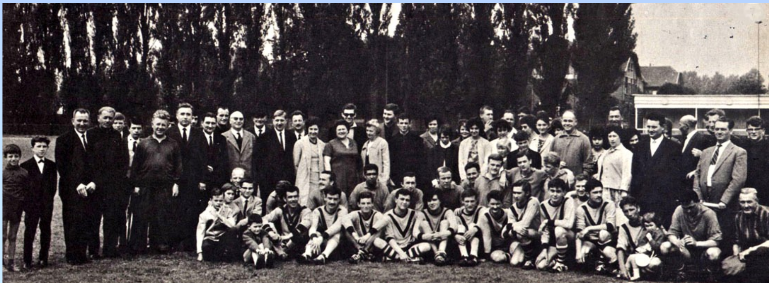
7. CE FUT UNE GRANDE FETE DE FAMILLE QUE LA RENCONTRE AMICALE QUI OPPOSA LES RESERVISTES DE L'A.S.S.B. A L'EQUIPE DU NOUVION ATHLETIC-CLUB, LE DIMANCHE 13 JUIN EN MATINEE.