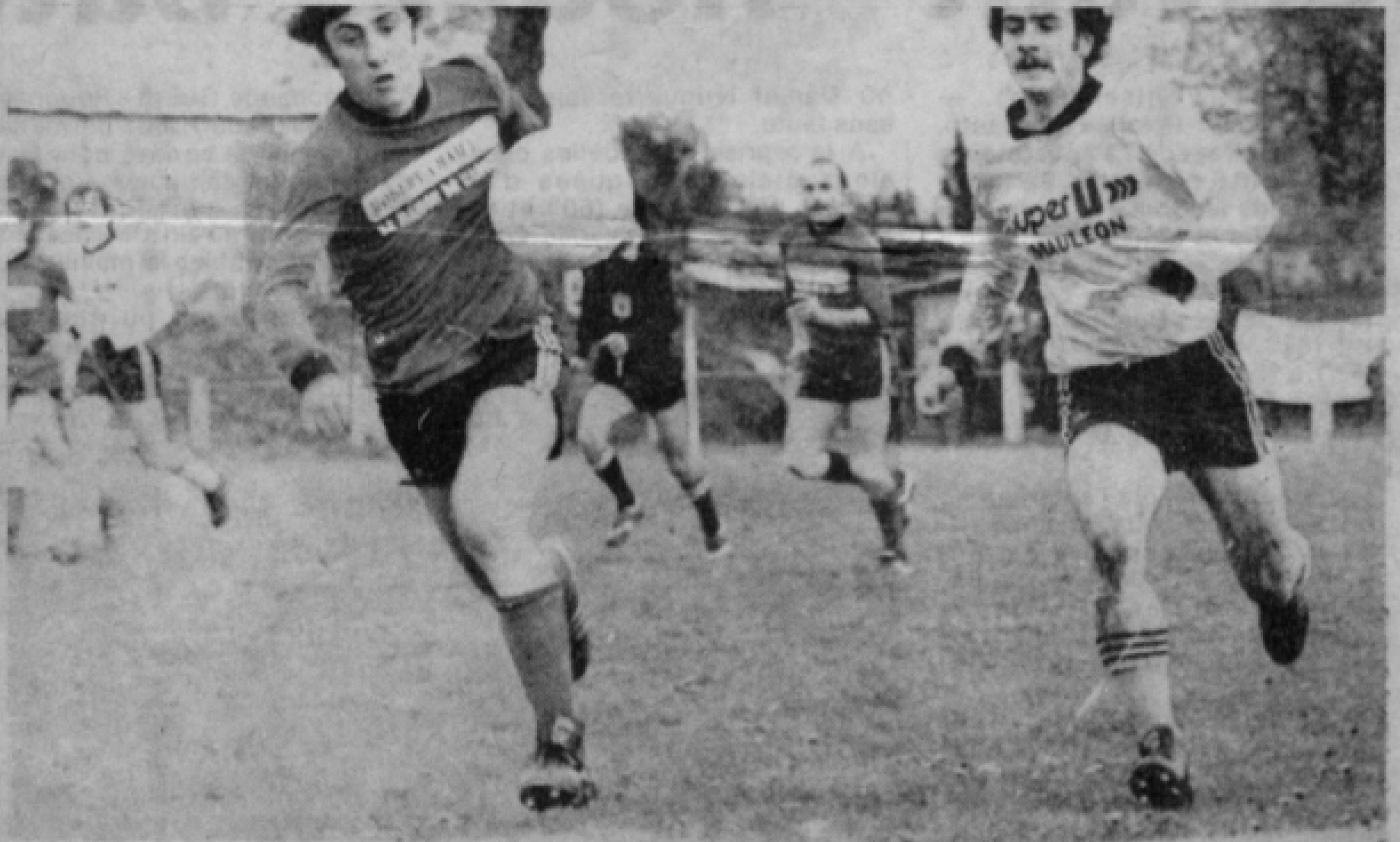
Chanteloup - Saint-Pierre. — Une balle très disputée