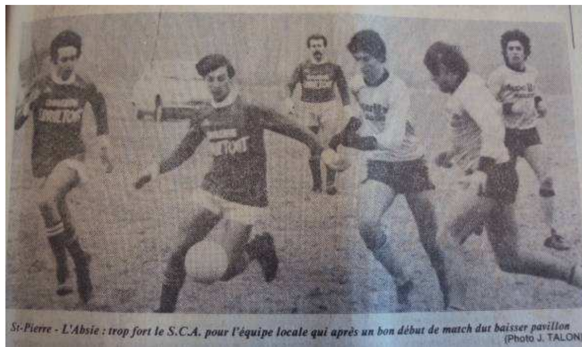
St-Pierre - L'Absie : trop fort le S.C.A. pour l'équipe locale qui après un bon début de match dut baisser pavillon

Clessé tente de déserrer l'étreinte mais ne parvient pas à inquiéter l'excellent gardien de Saint-Pierre. A la reprise les hommes de Deniau prennent le match en main et dominant.