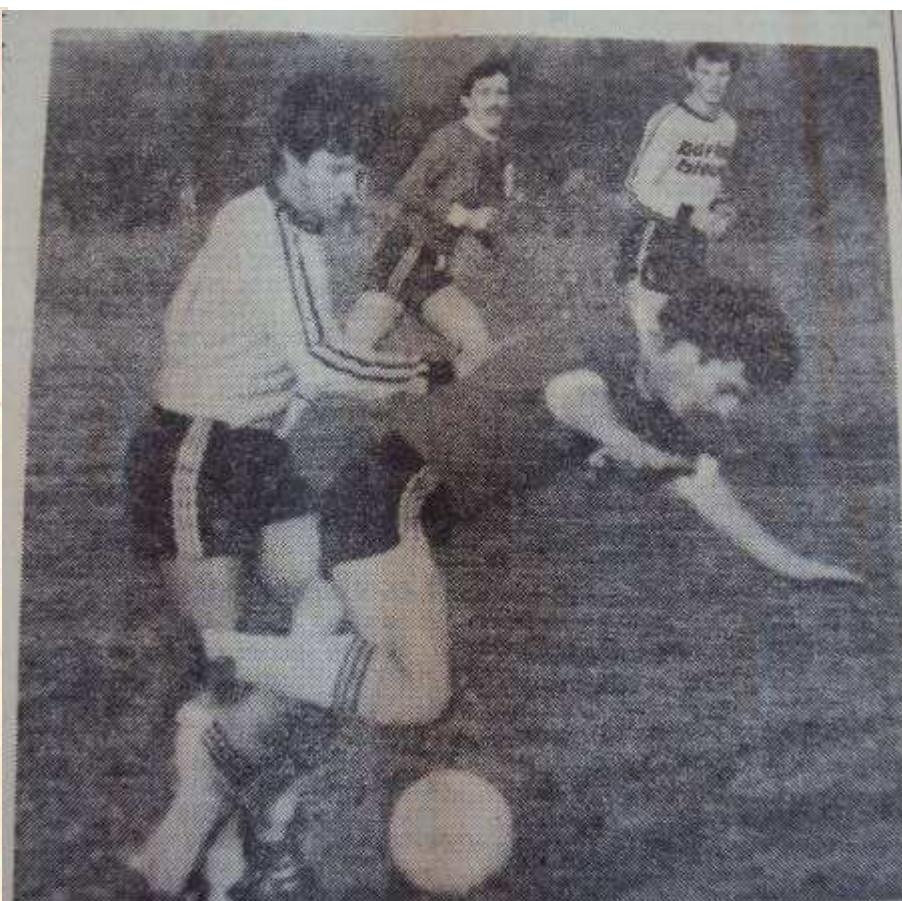
Première division, Saint-Pierre-des-Echaubrognes - Saint-Amand-sur-Sèvre : les contacts furent parfois rudes