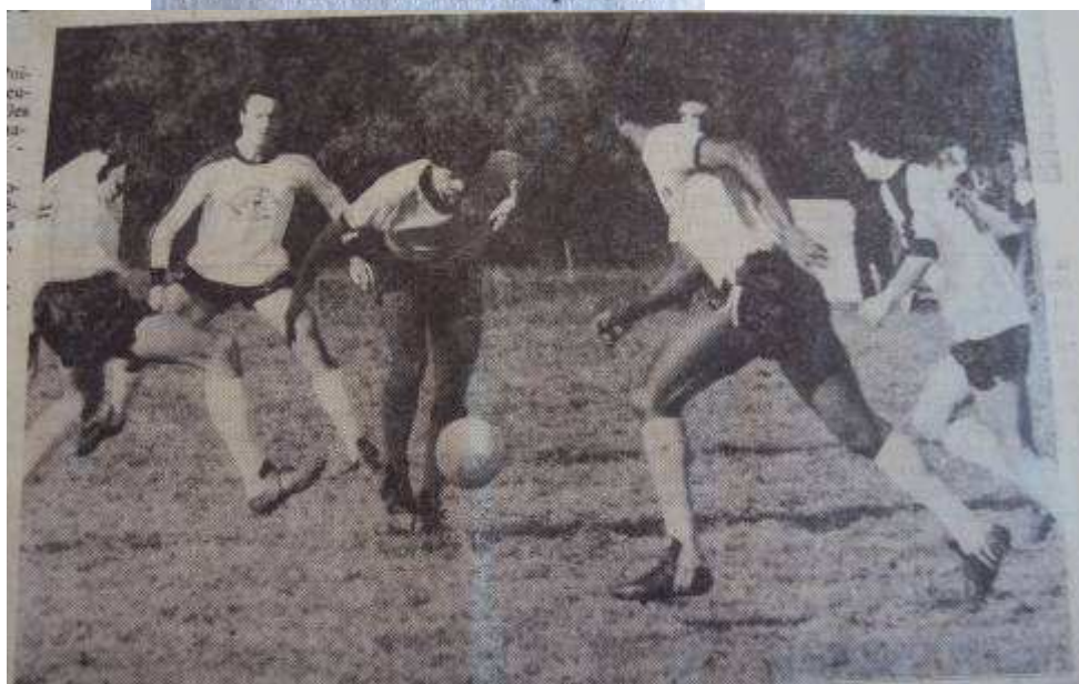
St-Pierre-des-Echaubrognes - St-Jouin-de-Marnes : les locaux, ici à l'attaque, ont dû partager les points

Sur leur terrain les joueurs de Saint-Pierre-des-Echaubrognes ont réussi une bonne performance en tenant en échec la formation de Saint-Jouin-de-Marnes. La première période était à l'avantage des locaux qui ouvraient la marque à la trentième minute par Sainte-Rose. Dès la reprise St-Pierre avait une excellente occasion de doubler la mise, mais sur la contre-attaque les visiteurs égalisaient. Le match était joué et la partie se terminait sur un résultat nul somme toute équitable.