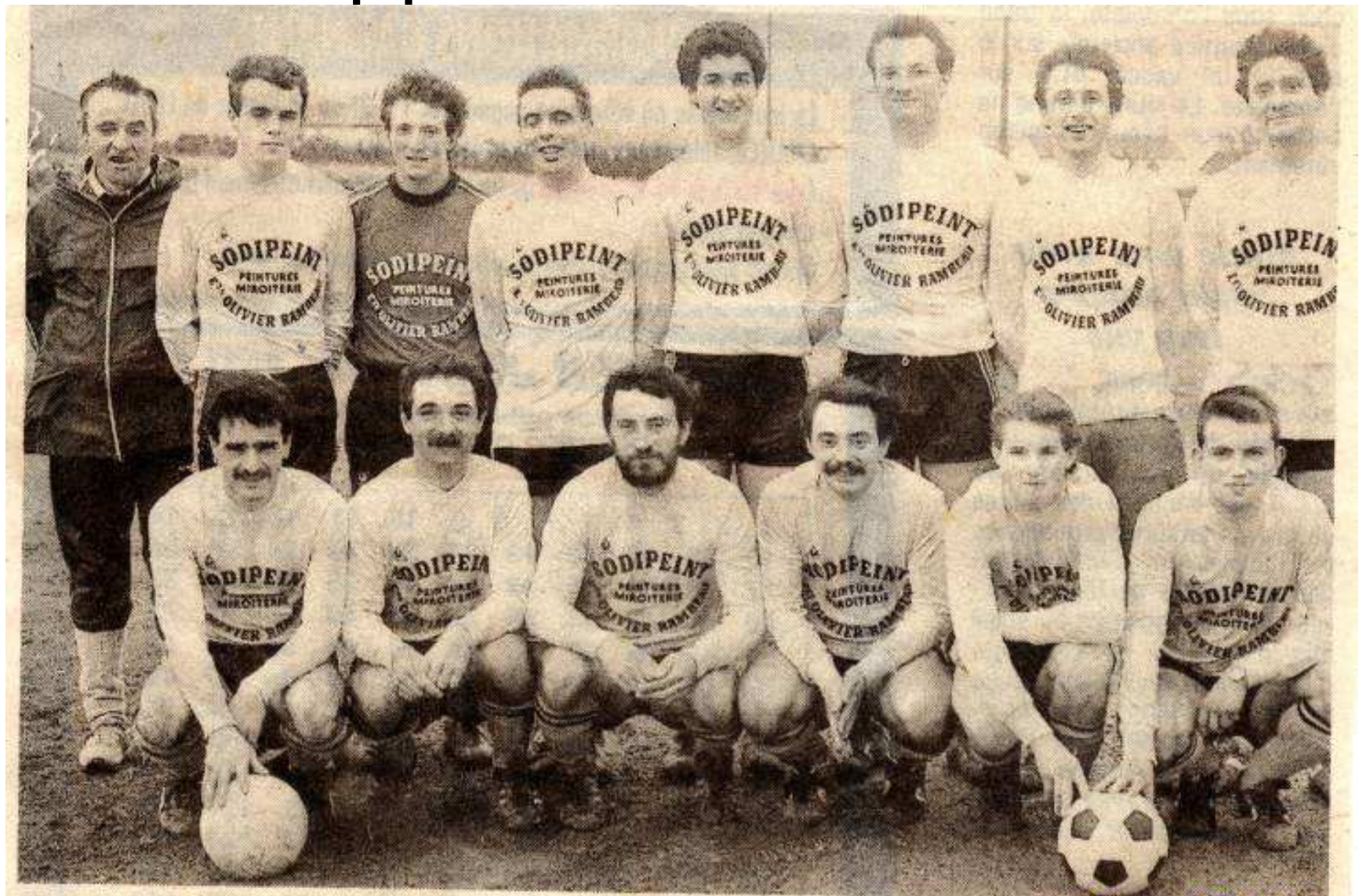
L'équipe de football de Saint-Pierre-des-Echaubrognes Saison 88-89

L'équipe 1 se maintient en 1 ère division