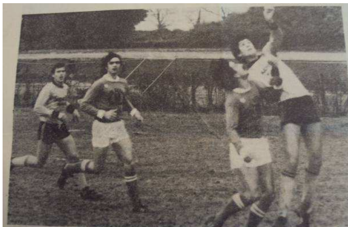
ST-PIERRE-DES-ECHAUBROGNES - CHICHE : sur leur terrain, les Echaubrognois ont subi la loi des Chichéens (maillot sombre).

18 décembre 1983 : 4ème Tour Coupe des Deux Sèvres