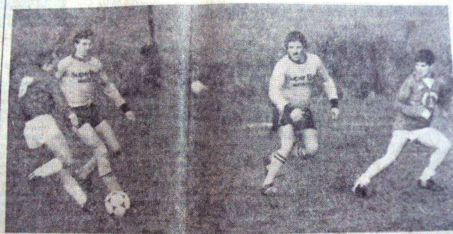
Saint-Pierre - Clessé : menés 2-0 jusqu'à la 69' mn, les locaux parvinrent à refaire leur retard... en l'espace de 3 mn