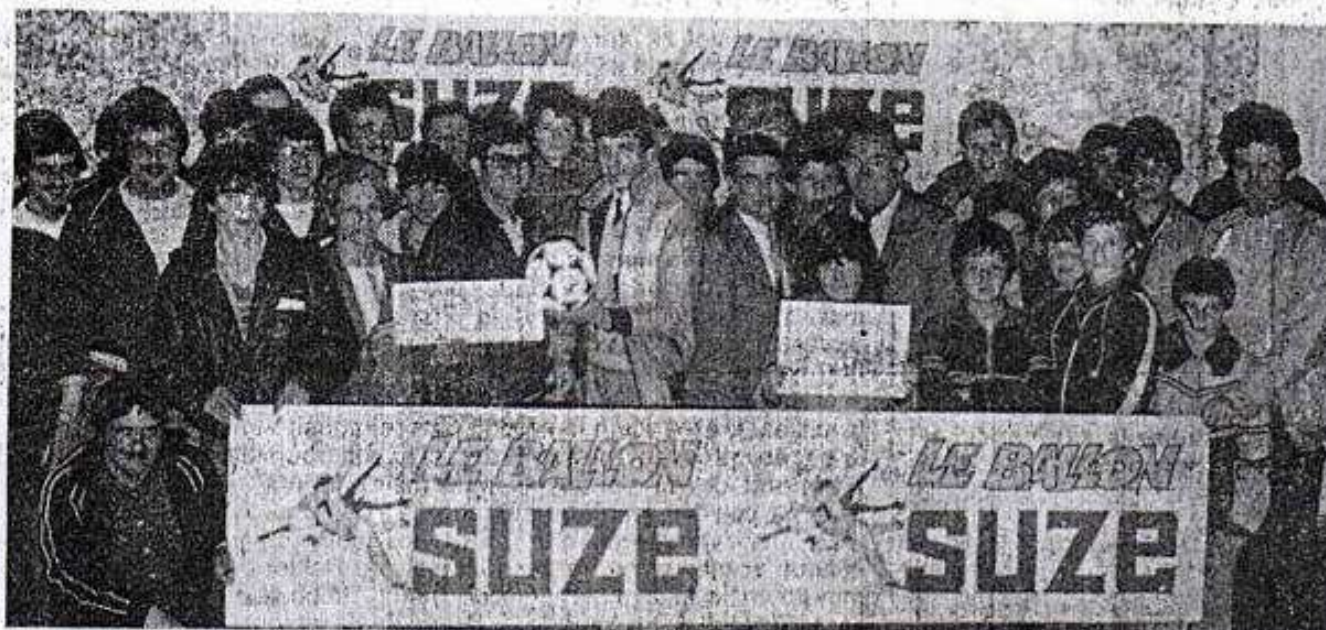
La remise du ballon Suze à l'A.S. St-Pierre : la récompense d'une saison exemplaire.