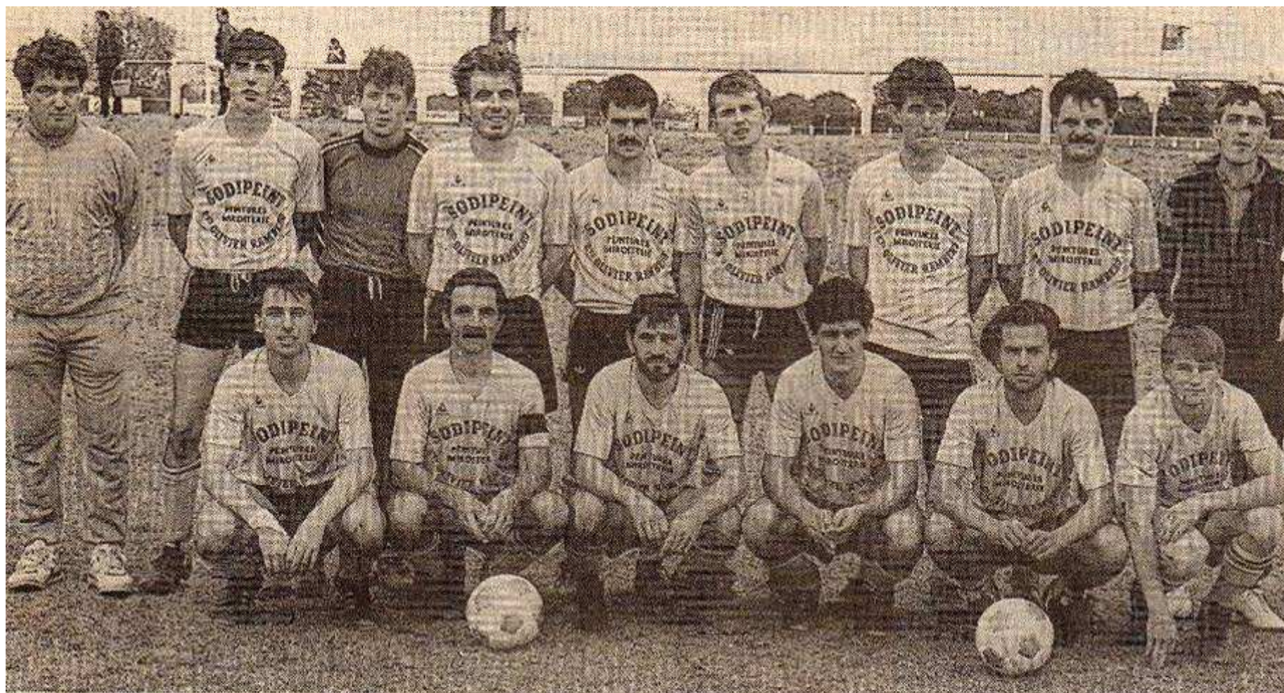
L'équipe première de Saint-Pierre-des-Echaubrognes Saison 89/90

L'équipe 1 se maintient en 1 ère division