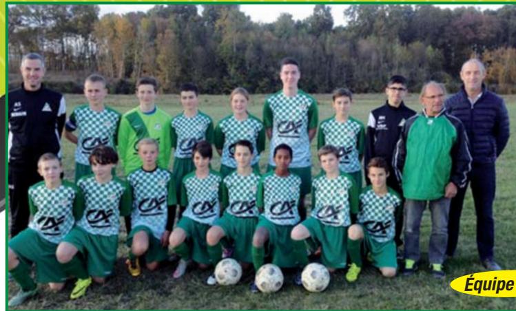
Équipe U 15