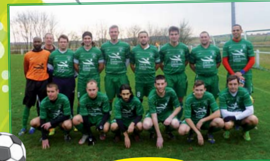
Équipe Séniors 2