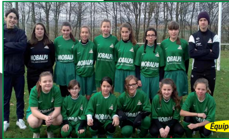
Equipe U15 F