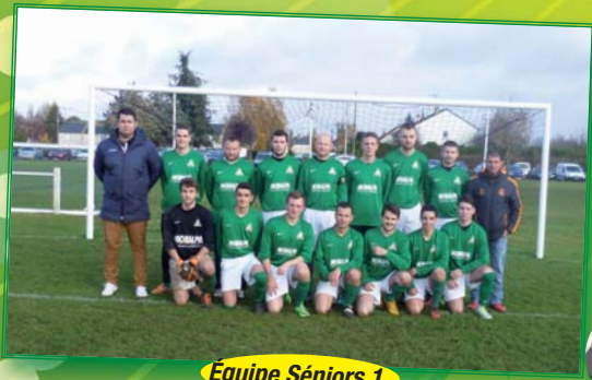
Équipe Séniors 1