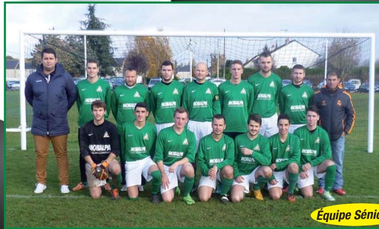
Équipe Séniors 1