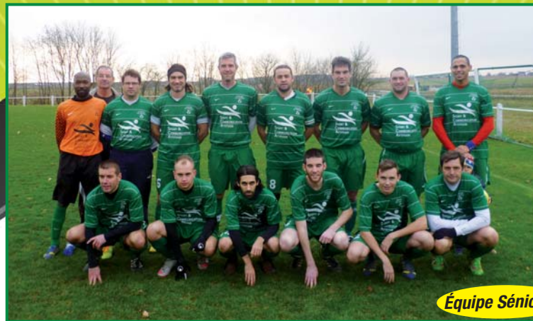
Équipe Séniors 2