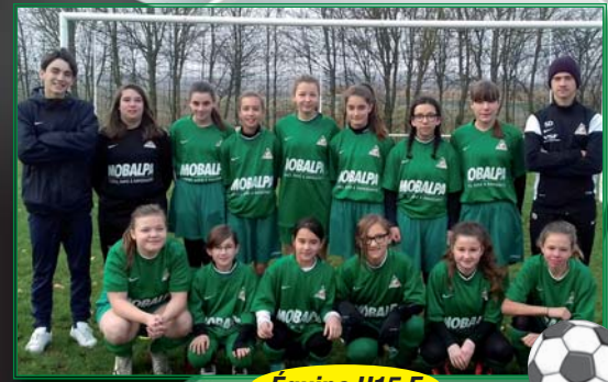
Équipe U15 F