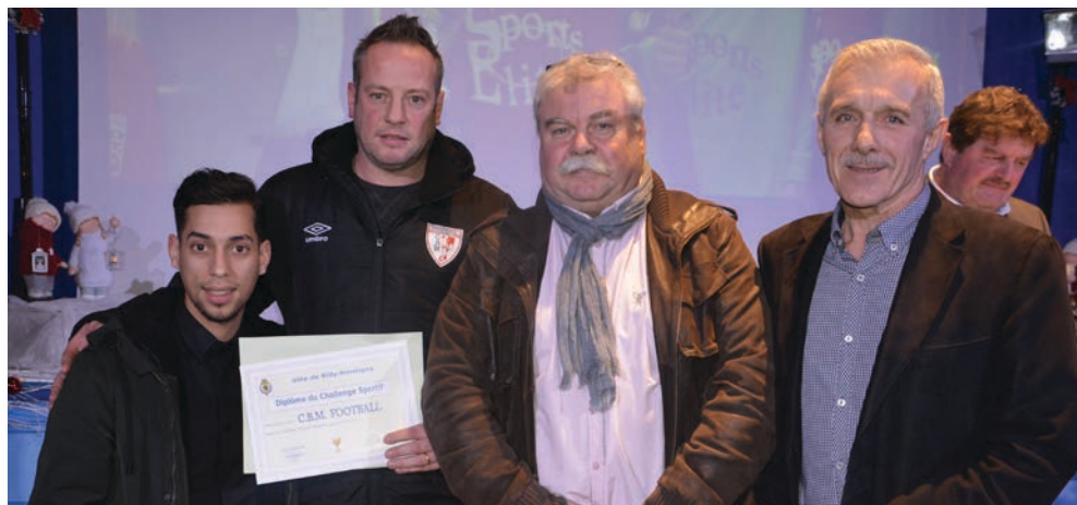
Les CBM football ont marqué l'année sportive 2016

La cérémonie des vœux à la population est aussi l'occasion de remettre le challenge sportif au club le plus méritant de la saison.