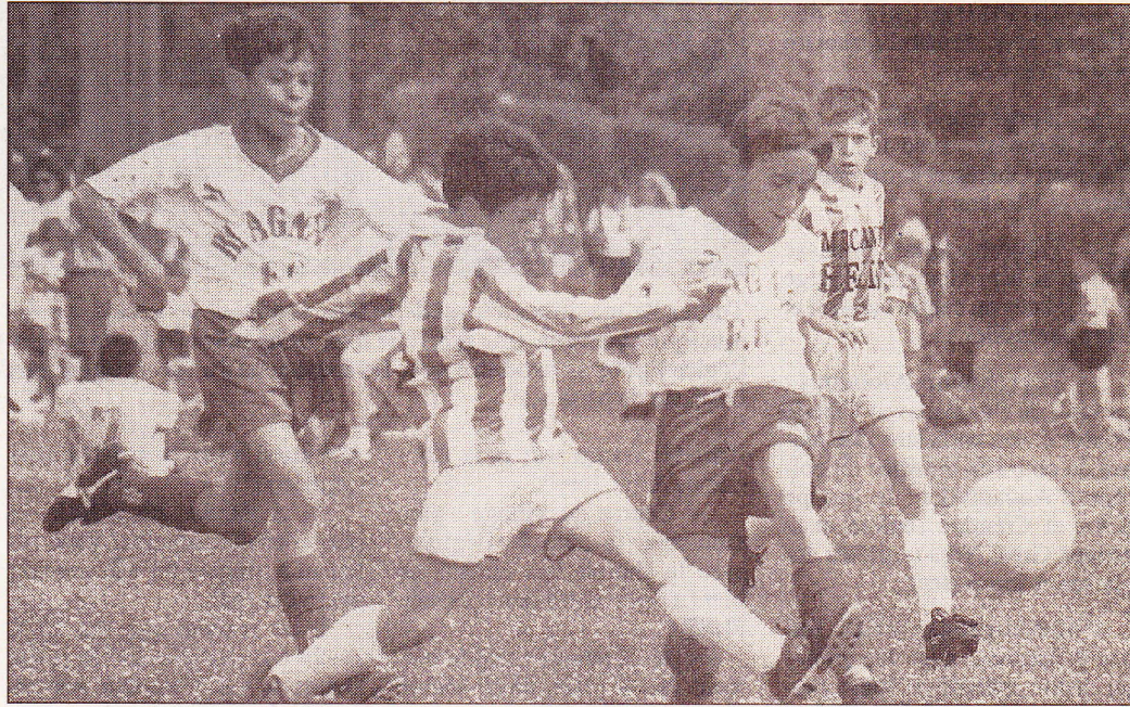
De futurs champions en herbes en catégorie moins de 11 ans.