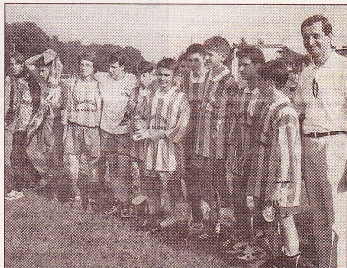
En moins de 15 ans, l'équipe de Saint-Jean, classée deuxième.