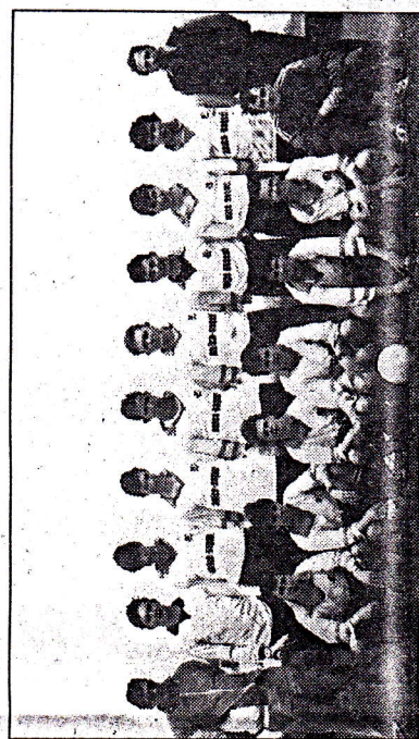
L'équipe de Lanrelas de moins de 17 ans.

Les dirigeants remercient vivement la municipalité et plus particulièrement les employés municipaux qui ont été mis à contribution toute la semaine, les sponsors, les familles, toutes les personnes qui ont participé directement ou indirectement à la réussite de ce 11 e Tournoi.