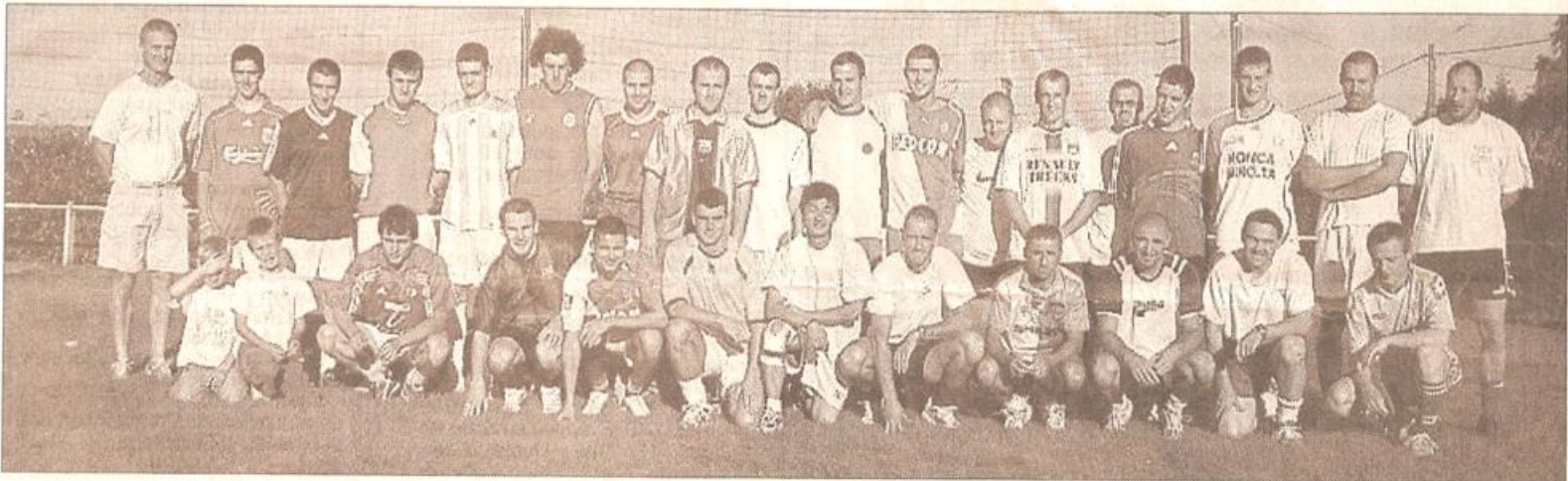
Le groupe présent le jour de la reprise de l'entraînement.

L'exercice 2007/2008 fut de belle facture pour les joueurs de Combranssière (PH) avec à la clé une cinquième place dans un championnat serré et truffé de derbies. L'année qui se présente désormais ne sera pas moins riche en matches entre voisins, mais un changement de taille vient avec l'exil de la Charente vers la Vienne pour les formations non deux-sévriennes. Pour sa troisième saison, le coach du club attend donc beaucoup, notamment après un recrutement intéressant qui a vu plus d'une