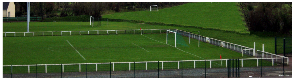
Un terrain de foot gazonné...