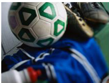
Un vestiaire équipé de douches

Le Collège LE FAIRAGE est situé à proximité d'un gymnase adapté à la pratique du football avec des vestiaires équipés de douches et un terrain de foot gazonné. La proximité de l'ensemble de ces installations permet de limiter les déplacements et un gain de temps pour réaliser d'autres activités.