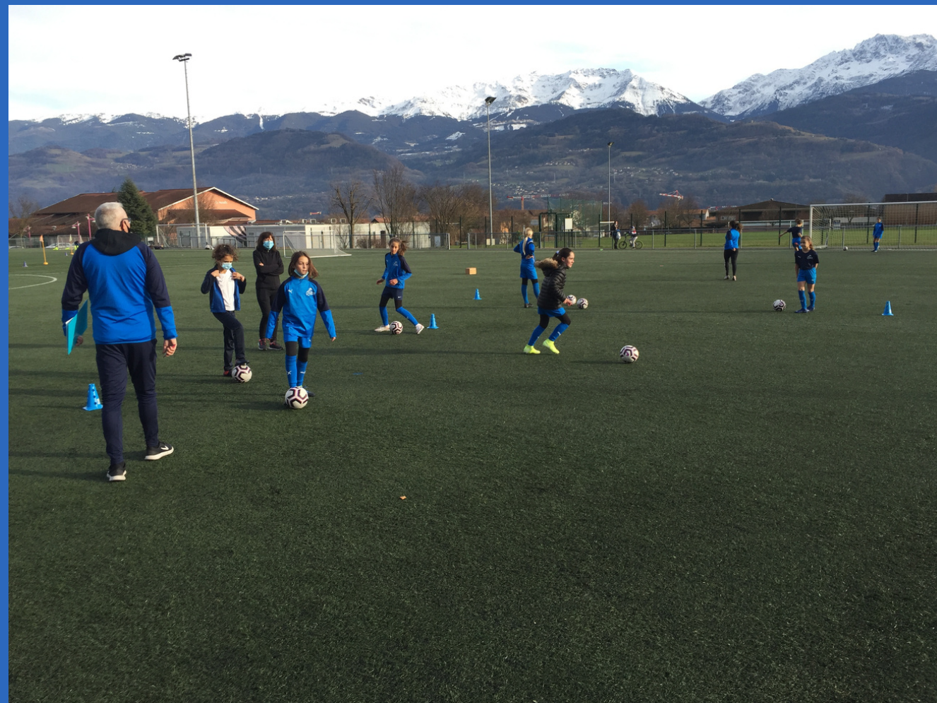
Avec les U11F