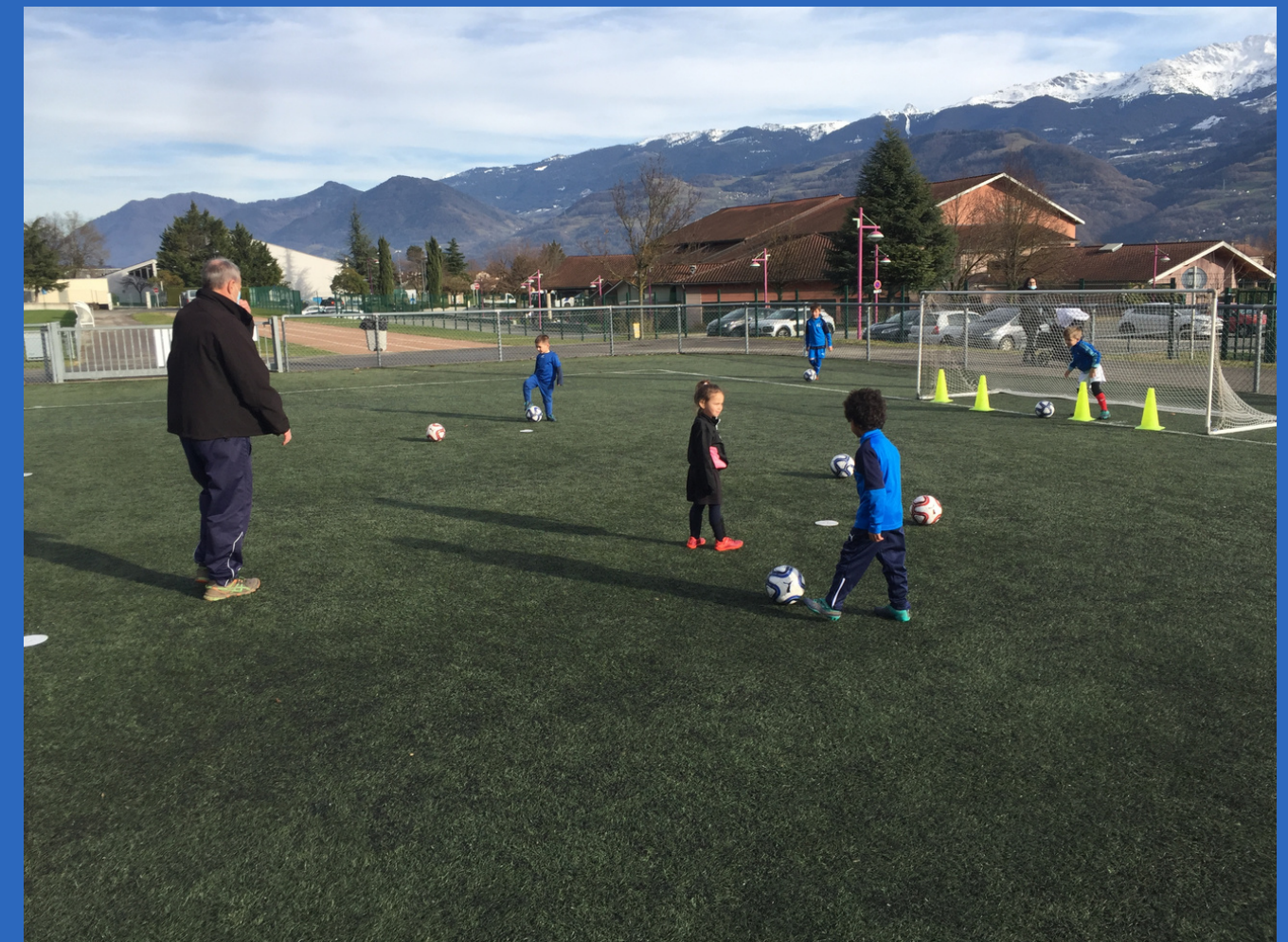
Avec les U7