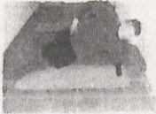
Gainage de coté, faire des petits mouvements du bassin de bas en haut. Alternier Gauche et droite 4x30'' / Récup alternance

Enchaîner les exercices en respectant l'ordre. Il n'y a pas besoin de récupération entre les exercices, puisqu'il s'enchaînent de manière cohérente.