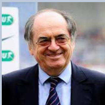
Noël LE GRAËT Président de la FFF