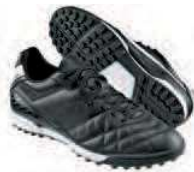
Crampons « stabilisés » Terrain synthétique