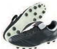
Crampons « moulés » Terrain sec ou dur

Pour entretenir ses chaussures de foot et les faire durer plus longtemps :