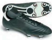
Crampons « vissés » Terrain gras ou humide