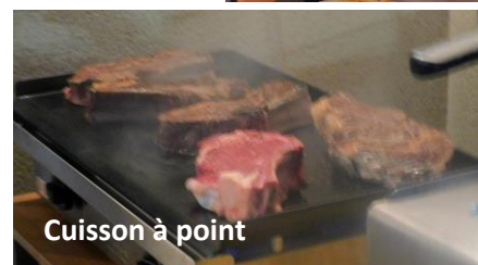
Cuisson à point