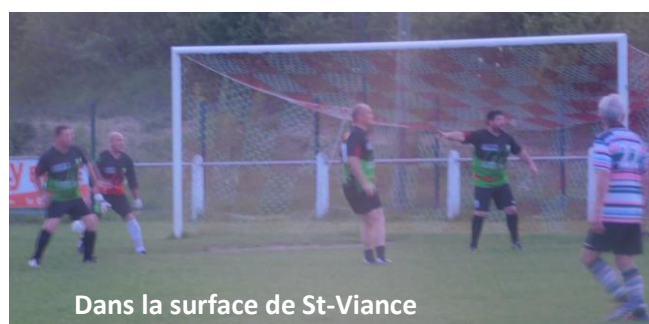
Dans la surface de St-Viance