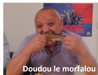
Doudou le morfalou

exonéré de jeu pour que nous puissions nous sustenter.