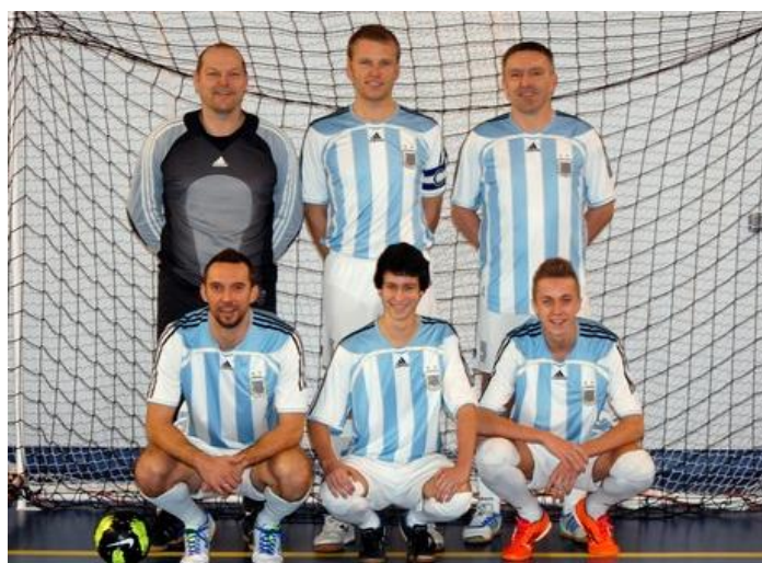
VT Virton A