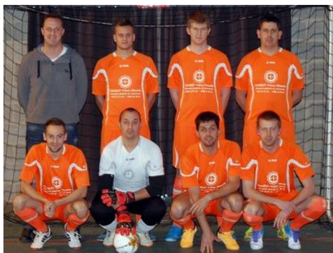
MFC Ochamps A