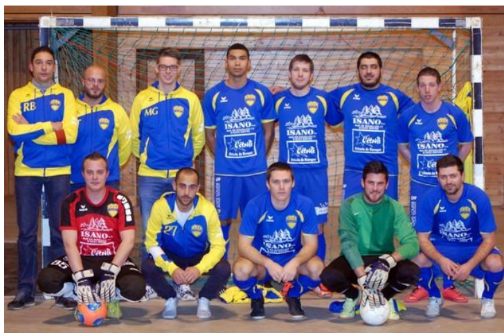
Boca Junior Libramont