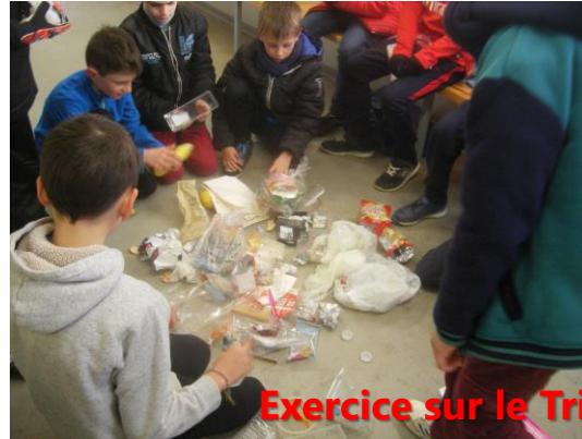
Exercice sur le Tri